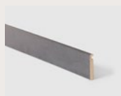
Dark Grey Stone